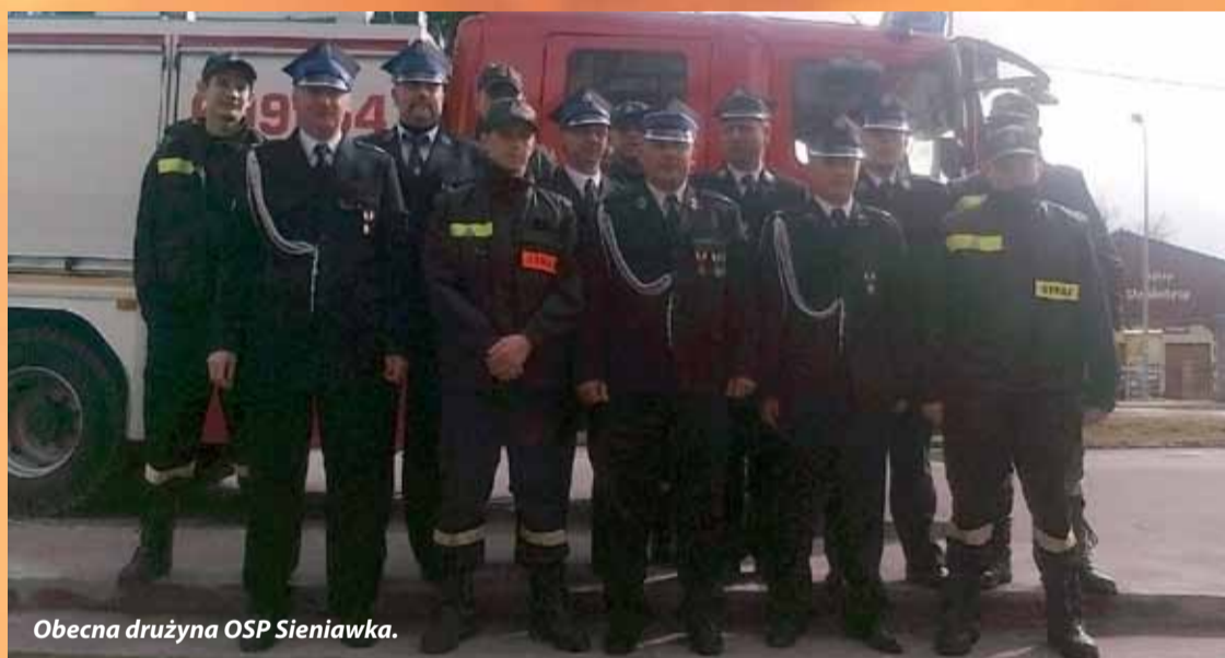
Obecna drużyna OSP Sieniawka.