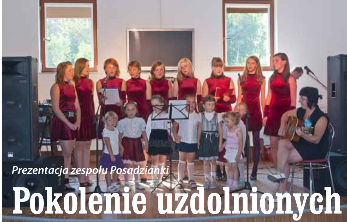
Prezentacja zespołu Posadzianki