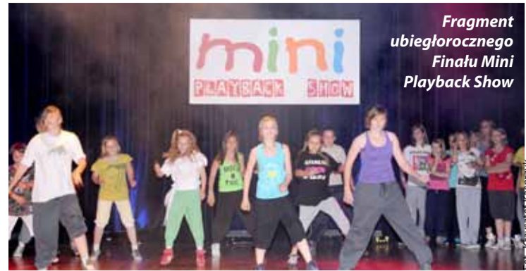
Fragment ubiegłorocznego Finału Mini Playback Show

Jury, po wnikliwej analizie prezentacji postanowiło przyznać kolejne miejsca i wyróżnienia w poszczególnych kategoriach: