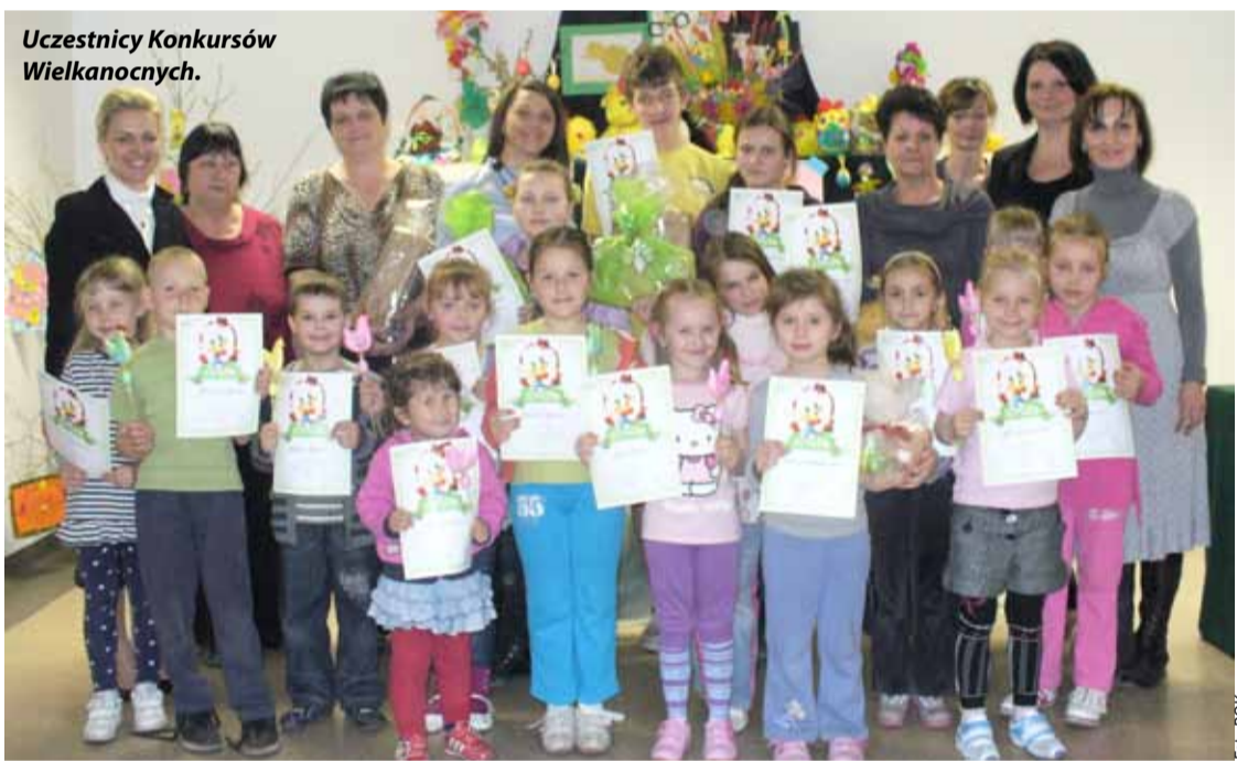
Uczestnicy Konkursów Wielkanocnych.