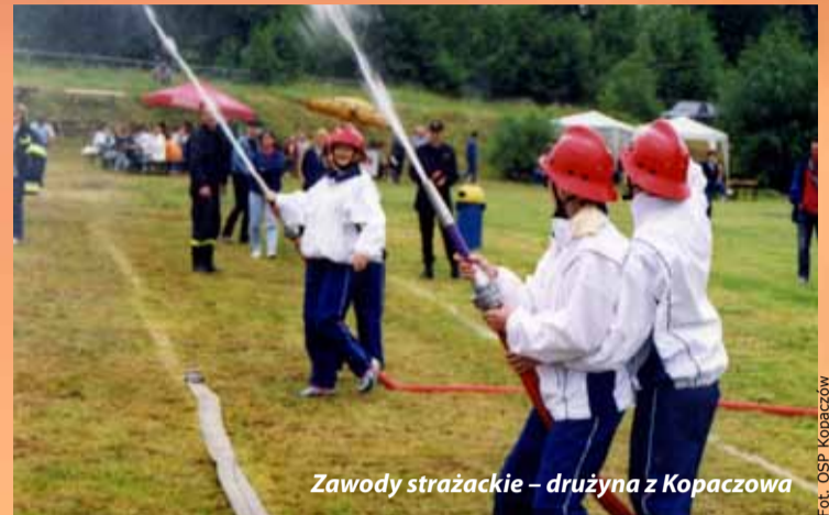
Zawody strażackie – drużyna z Kopaczowa

W 2009 r. OSP w Porajowie otrzymała pojazd marki Volvo. Dzięki niemu jednostka ma