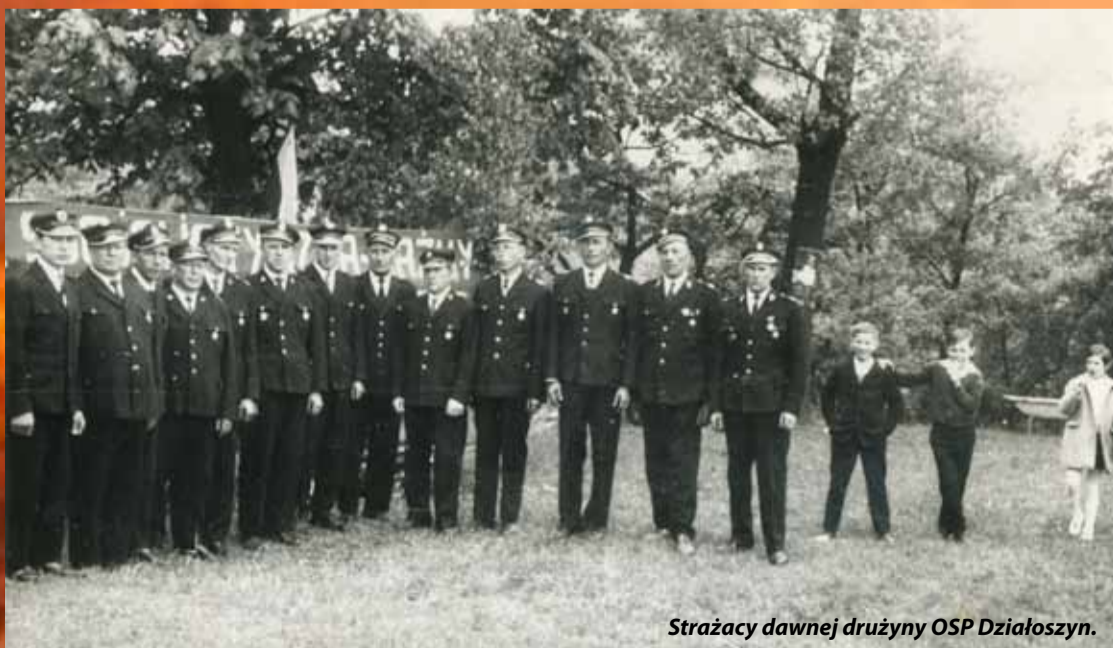
Strażacy dawnej drużyny OSP Działoszyn.