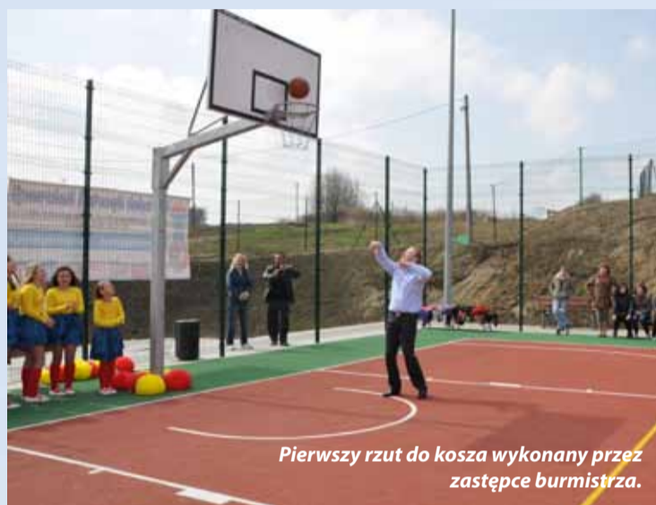
Pierwszy rzut do kosza wykonany przez zastępcę burmistrza.