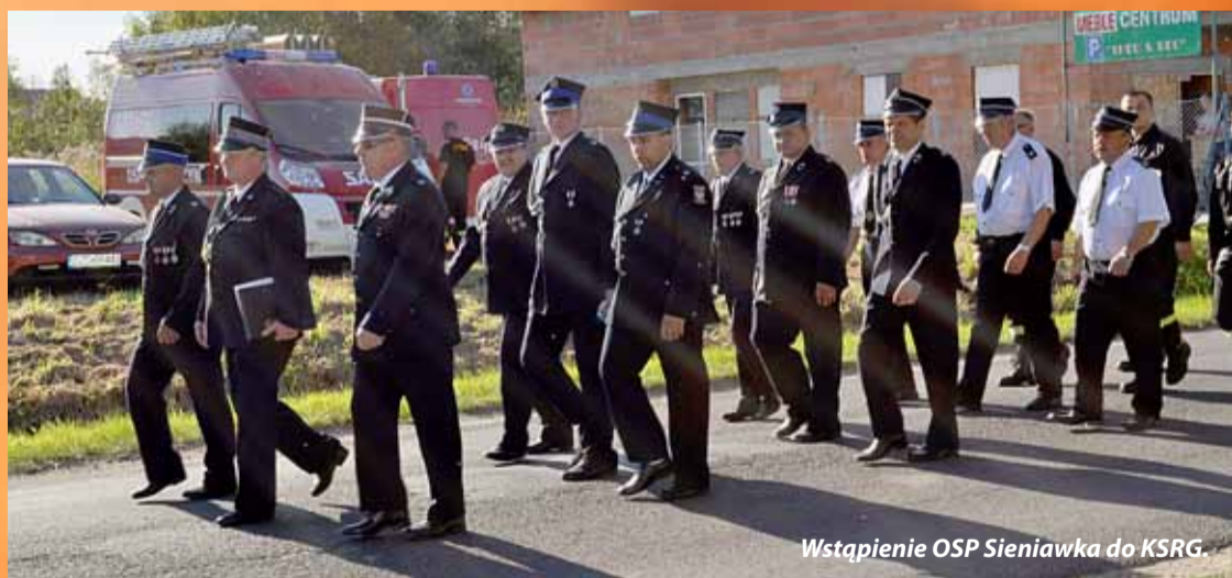
Wstąpienie OSP Sieniawka do KSRG.