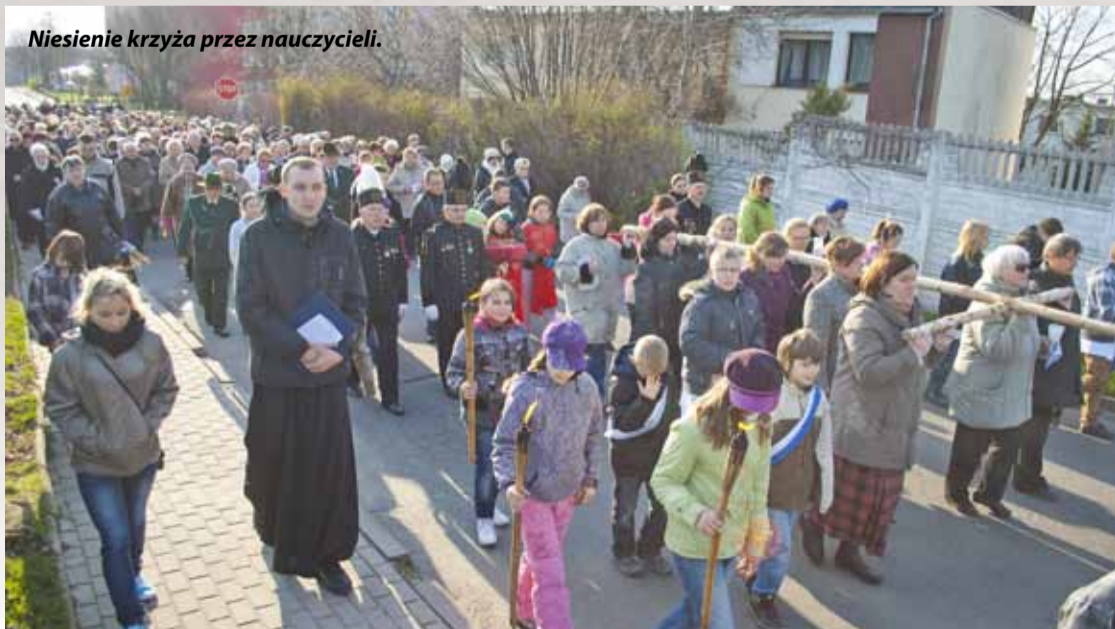
Niesienie krzyża przez nauczycieli.