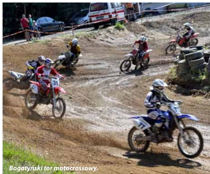
Bogatyński tor motocrossowy.