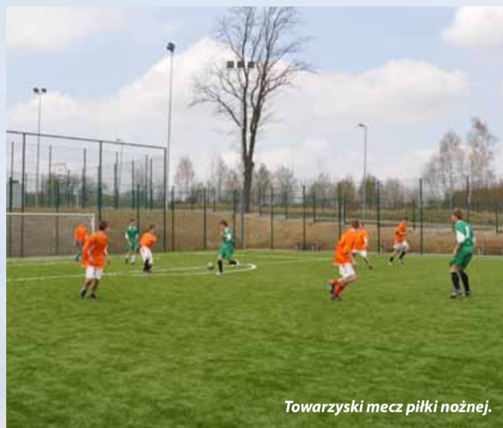
Towarzyski mecz piłki nożnej.