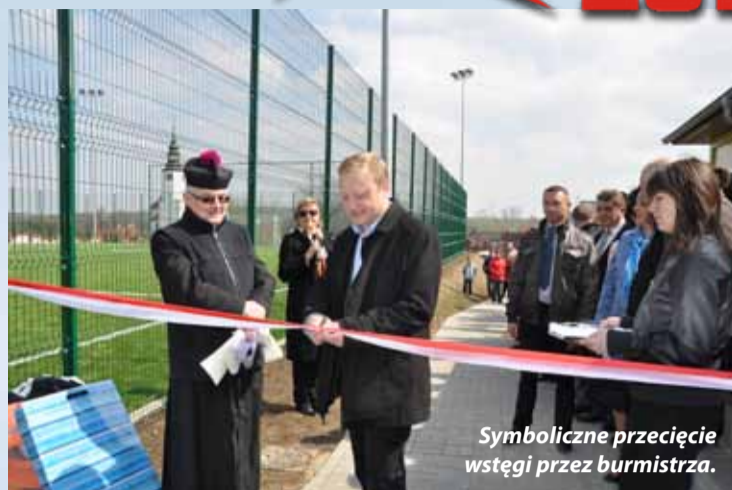
Symboliczne przecięcie wstęgi przez burmistrza.