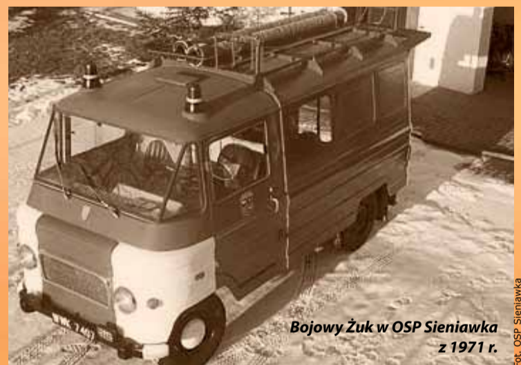
Bojowy Żuk w OSP Sieniawka z 1971 r.