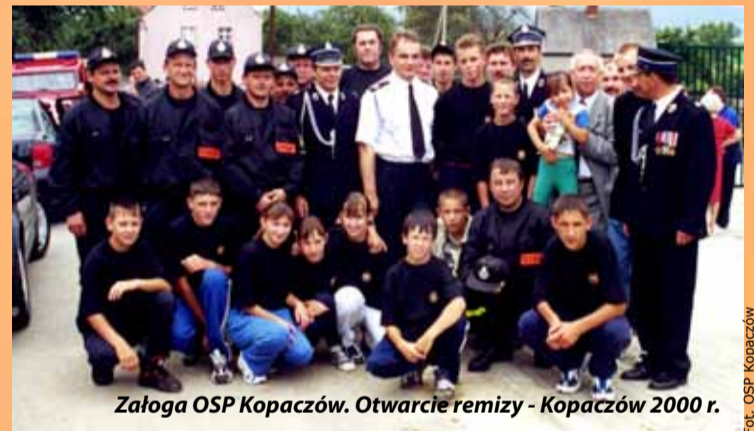
Załoga OSP Kopaczów. Otwarcie remizy - Kopaczów 2000 r.