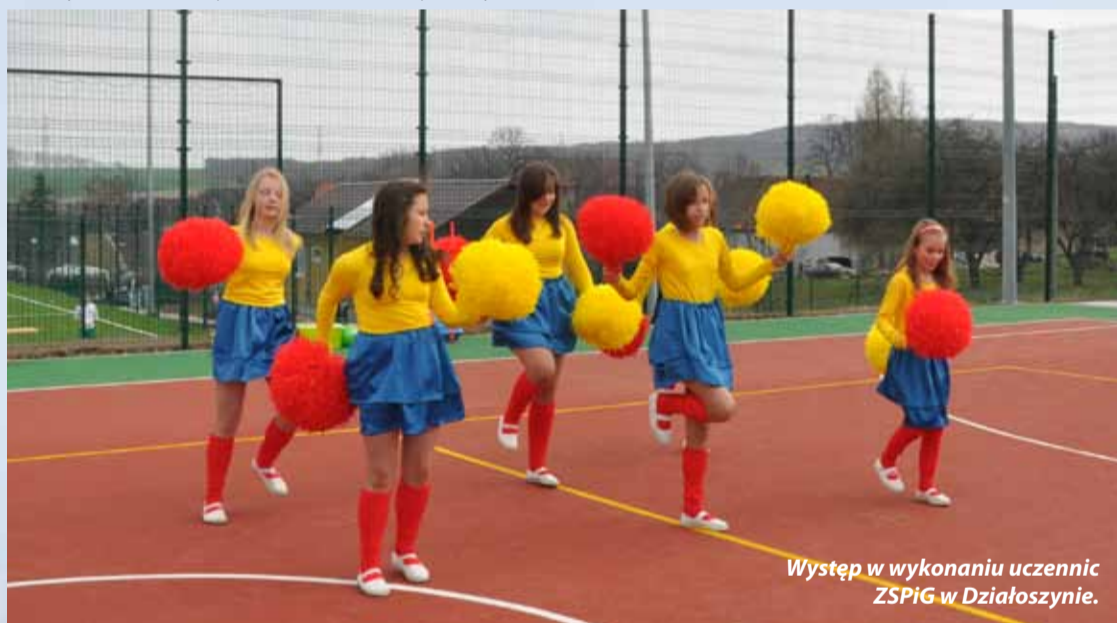
Występ w wykonaniu uczennic ZSPiG w Działoszynie.