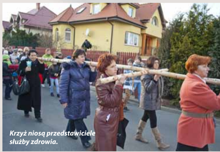
Krzyż niosą przedstawiciele służby zdrowia.