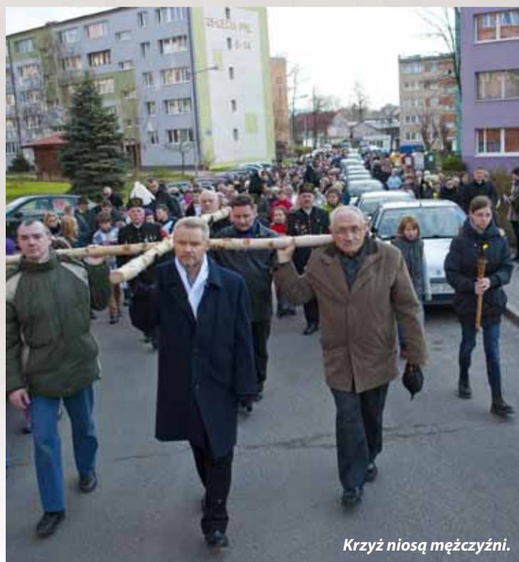
Krzyż niosą mężczyźni.