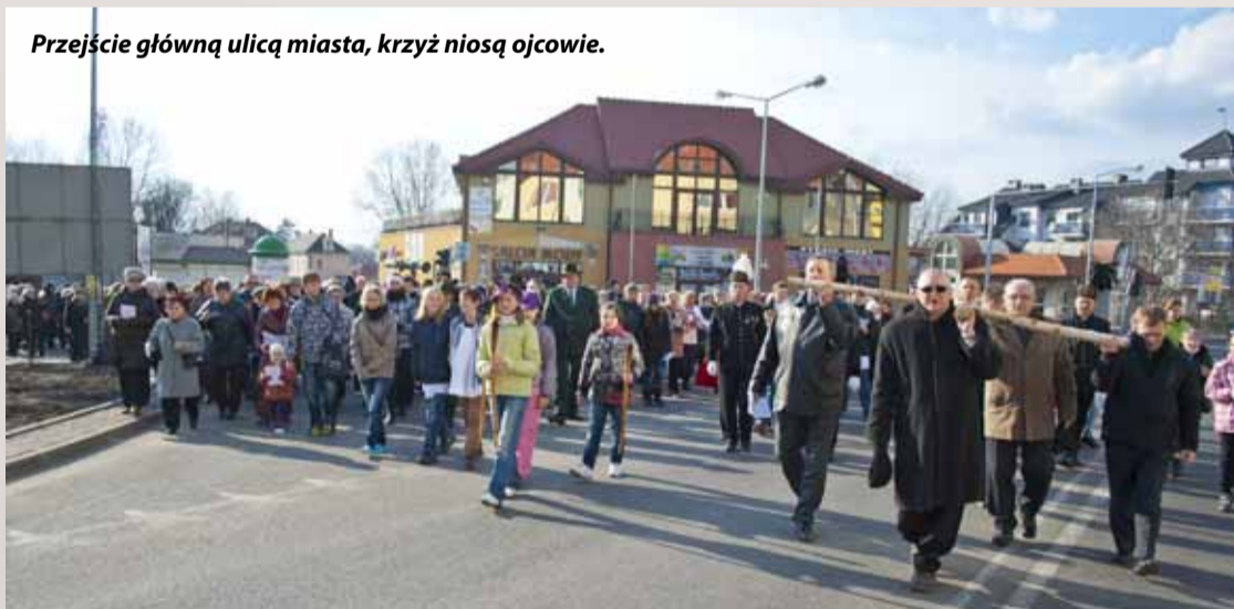
Przejdzie główną ulicą miasta, krzyż niosą ojcowie.