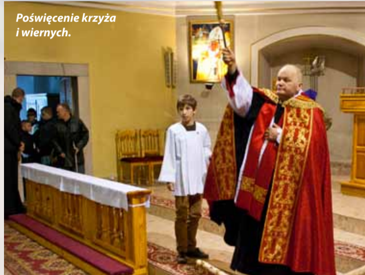
Poświęcenie krzyża i wiernych.