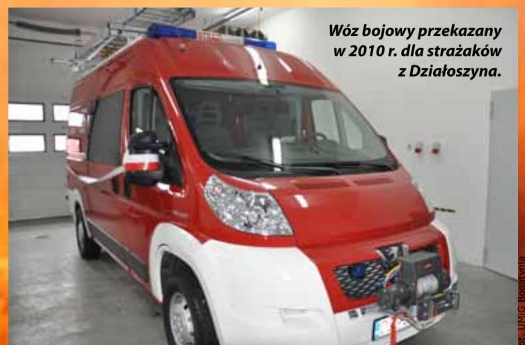
Wóz bojowy przekazany w 2010 r. dla strażaków z Działoszyna.