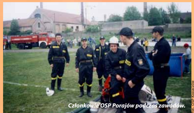
Członkowie OSP Porajów podczas zawodów.